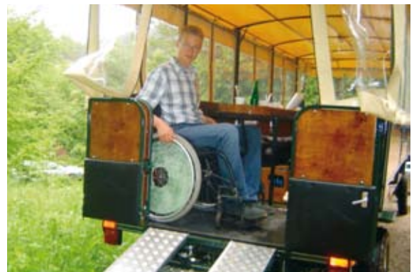
Planwagen mit mobiler Rampe