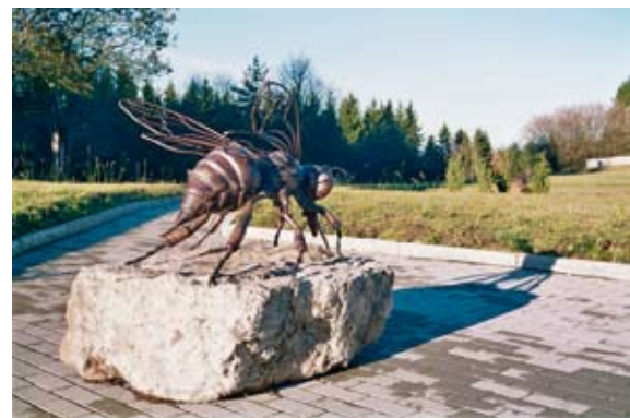
Insektenmodell zum Ertasten