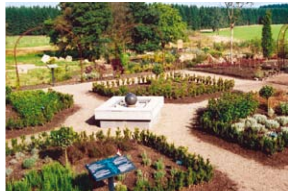
Herba Sana Garten