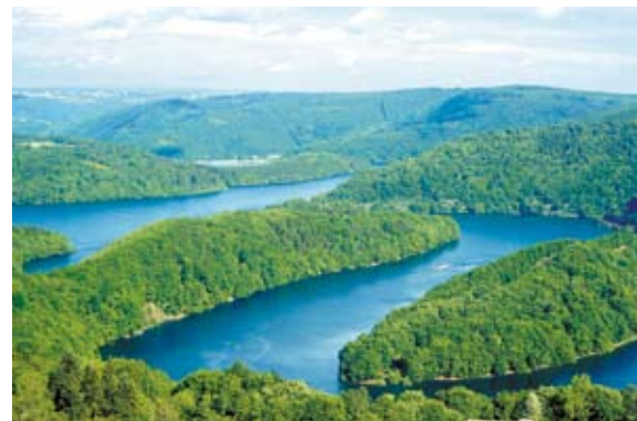
Urftsee bei Schleiden-Gemünd