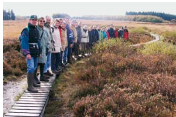
Wanderung im Hohen Venn