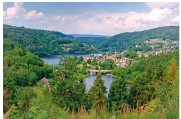
Blick auf den See