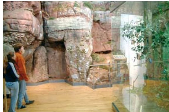
Ausstellung „Rur und Fels“