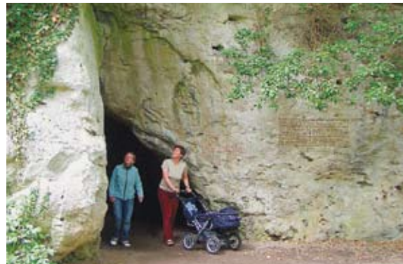
Eingang zur Kakushöhle