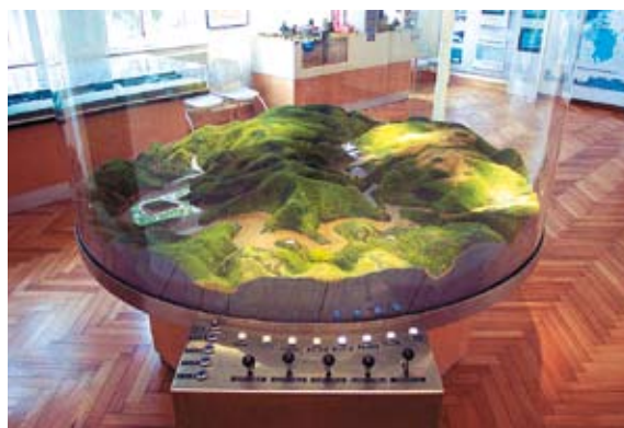
Modell zum Experimentieren