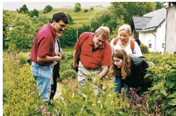
Pflanzenerkundung im Naturzentrum