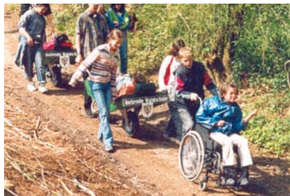
Die „Rollende Waldschule“ unterwegs