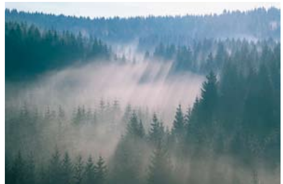
Nebel in der Hoheifel