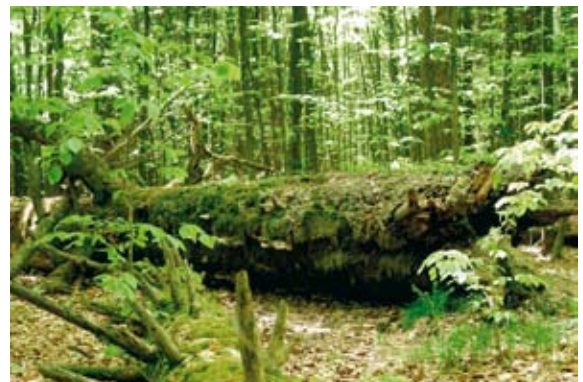
Buchenwald im Nationalpark Eifel