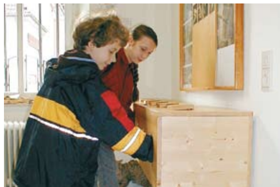
Kinder beim Erfühlen von Objekten