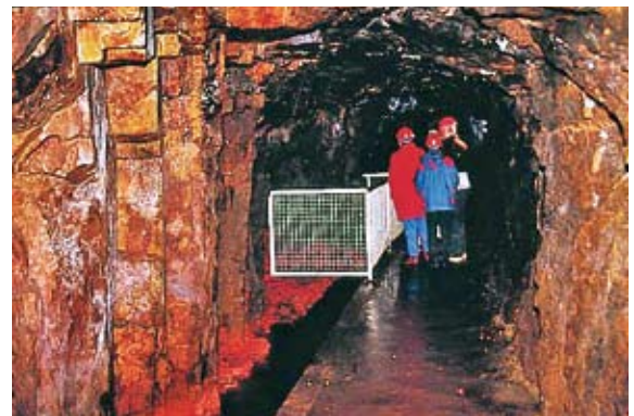
Führung durch das Bergwerk