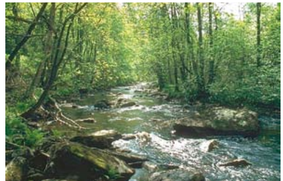
Auenwald der Rur im Nationalpark