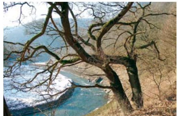
Eiche am winterlichen Urftsee

Urftseeroute ganzjährig befahrbar Fahrradverleih (Tandems) kostenpflichtig Kurhausstraße 6 Telefon: (+49) 0 24 44 / 2011 E-Mail: info@gemuend.de Internet: www.gemuend.de Touristik Schleidener Tal e.V. Nationalparktor Gemünd 53937 Schleiden-Gemünd